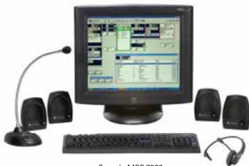
Consola MCC 7500

El nodo ASTRO 25 le permite implementar Consolas de Despacho IP MCC 7500 y MCC 7100 de Motorola y contar con encriptación de extremo a extremo extremadamente segura para todo el tráfico cursado entre operadores y usuarios en campo. La interfaz gráfica de usuario es similar a la interfaz CENTRACOM™ Gold Elite ya conocida por muchos operadores, de modo que la transición será rápida y con mínima capacitación.