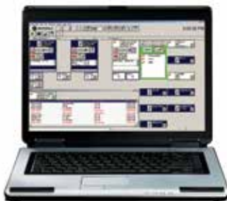
Consola MCC 7100